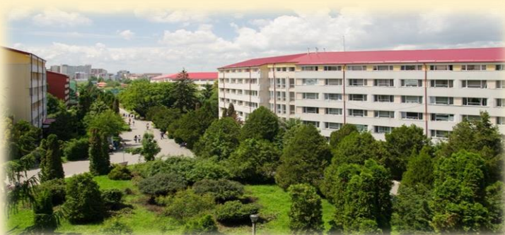
Technical University of Cluj-Napoca